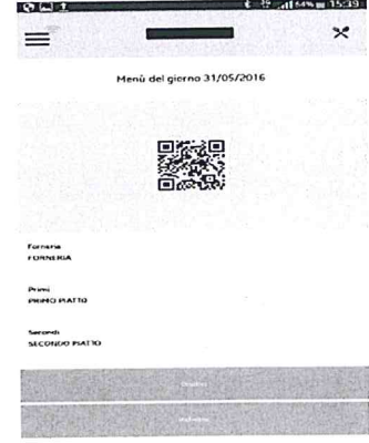
رمز الاستجابة السريع

يمكن إلغاء الحجز عن طريق اختيار اليوم المراد، ونقر الزر "Disdici"