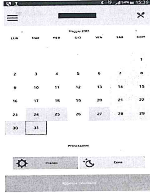
عرض أيام حجز الوجبة